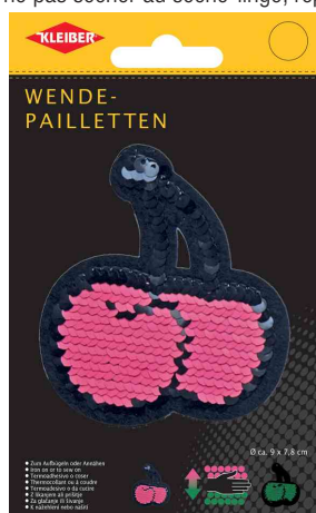
Cerises en sequins réversibles, rose-vert