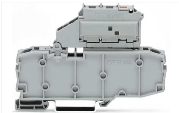
Farbe: ■ grau