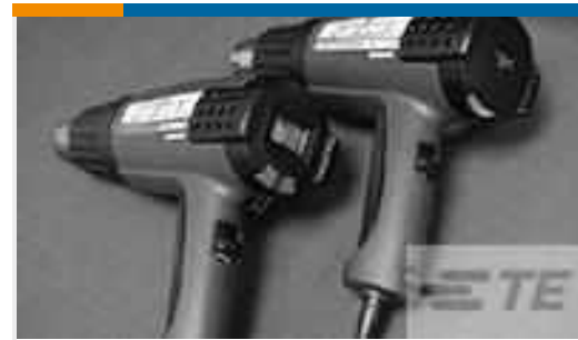
TE Teilenummer CJ2087-000 HL2010E-KIT-120V