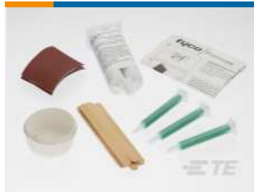
TE Teilenummer 657863-000 S1125-KIT-8