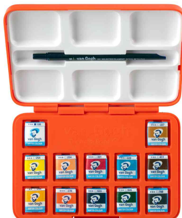
Pocket box aquarelle Van Gogh x "Autoportrait", ouverte