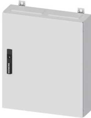
ALPHA 160 DIN Wandverteiler Aufputz mit Verteilerfeld, IP44, Schutzklasse 2 H=650mm, B=550mm, T=140mm RAL 9016