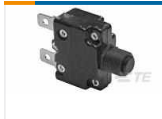
TE Teilenummer2-1423675-5 W57-XB2A99C10-15=CKTBKR,THERM,