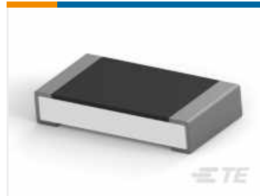
TE Teilenummer4-2176388-3 RQ 1206 27R4 0.1% 10PPM 5K RL