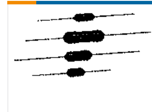
TE Teilenummer4-1879642-7 H8 500K 0.1% 25PPM