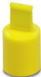
Schutzkappe aus Kunststoff für QPD-Steckverbinder 3(4)x 1,5 mm 2 , IP50

Bitte beachten Sie, dass die hier angegebenen Daten dem Online-Katalog entnommen sind. Die vollständigen Informationen und Daten entnehmen Sie bitte der Anwenderdokumentation. Es gelten die Allgemeinen Nutzungsbedingungen für Internet-Downloads. ( http://phoenixcontact.de/download )