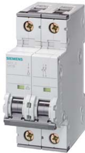
LS-SCHALTER 230V T=70MM 25KA NACH EN 60947-2, 1P+N, C8