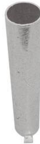
Modellbeispiel Bodenhülse Ø 60 mm für Profilzylinder und Dreikant (Art. 460.40)