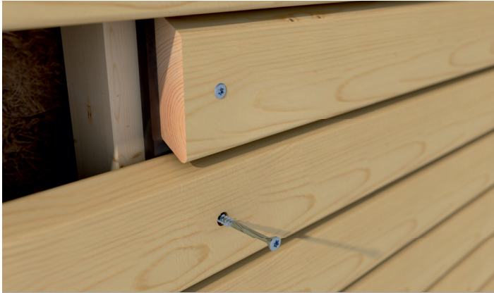
Anwendungsbeispiel der Hobotec.