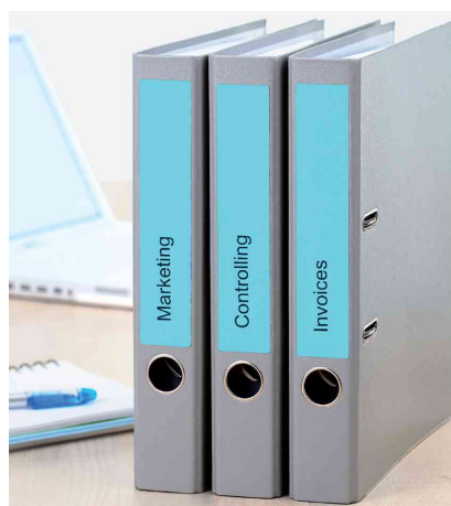
Étiquettes pour dos de classeur, SPECIAL, utilisation