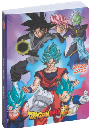
Agenda scolaire FORUM "Dragon ball S", Rose