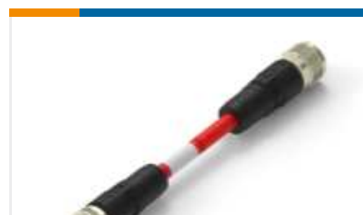
TE Teilnr.:TAA545B1411-060 M12A4-MS-FS-PVC-6.0M