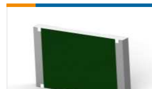
TE Teilnr.:8-2176407-8 3560 27R 5%