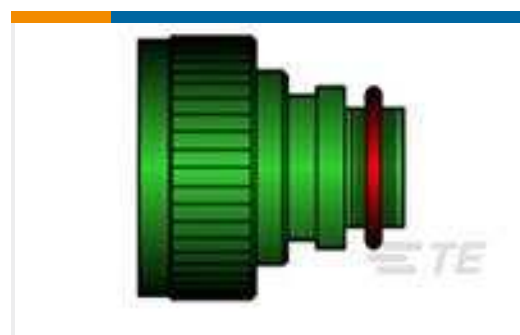
TE Teilnr.:320635-000 TXR41AB00-1406AI