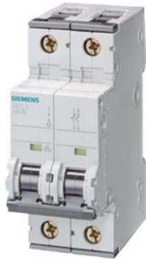
Leitungsschutzschalter 230V T=70mm 25kA nach EN 60947-2, 1P+N, D13