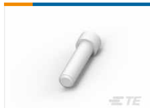
TE Teilnr.:114017-ZZ SEALING PLUG, SIZE 12/16, WHT