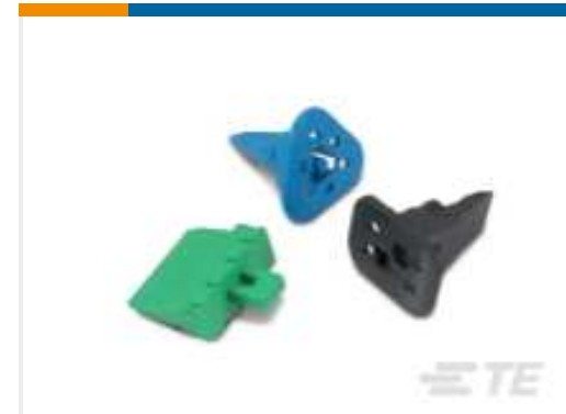
TE Teilnr.:W2S DEUTSCH DT Keilschlösser