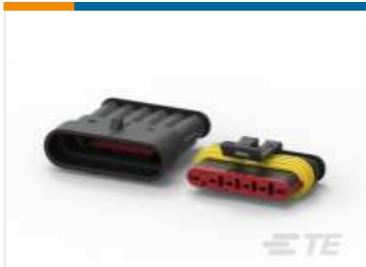
TE Teilnr.:282104-1 AMP SUPERSEAL 1.5MM, STECKVERBINDERGEHÄUSE