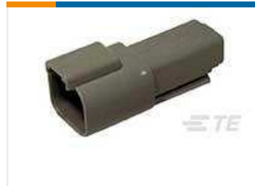
TE Teilnr.:DT04-2P REC, 2P, GRY, N