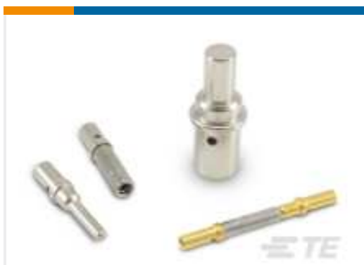
TE Teilnr.:0460-202-16141 DEUTSCH Kontakte