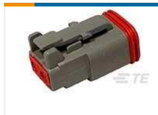
TE Teilnr.:DT06-2S PLG, 2P, GRY, N