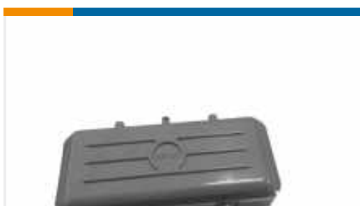
TE Teilnr.:T1010162100-000 H16B-KDBP