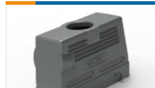
TE Teilnr.:T1240240121-000 H24B-TGH-PG21