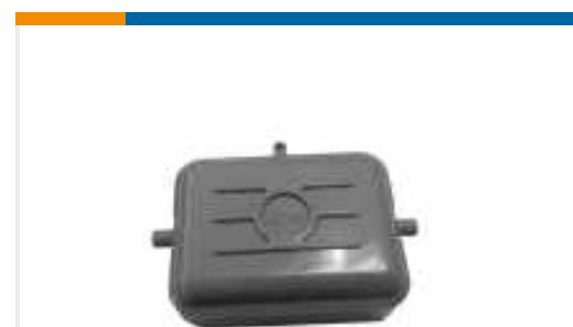
TE Teilnr.:T1010062100-000 H6B-KDBP