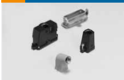
Hauben und Basis für rechteckige Steckverbinder(1258)