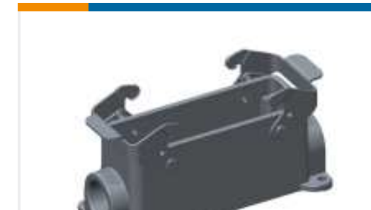
TE Teilnr.:T1440242121-000 H24B-SGR-PG21