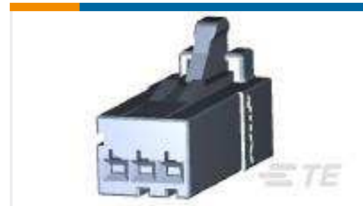
TE Teilnr.:3-1318120-3 DYNAMIC D-2 REC HSG 3P Z-KEY