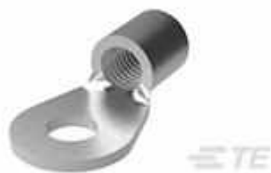
TE Teilenummer 35184 TERMINAL, SOLIS R 2 3/8