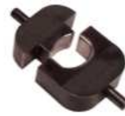
TE Teilenummer 45433 HYP8/10 SOLIS 2AWG DIE SET