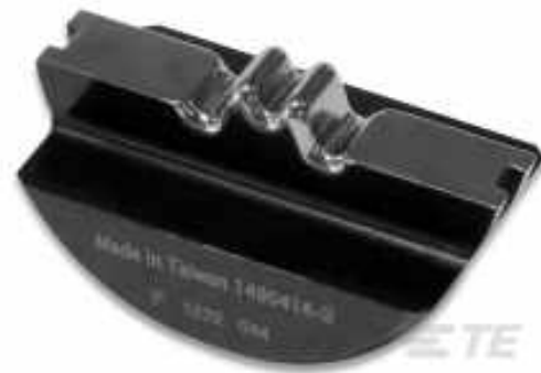
TE Teilenummer 1490414-2 HYP10 SOLIS HD 6-4AWG INDENTER