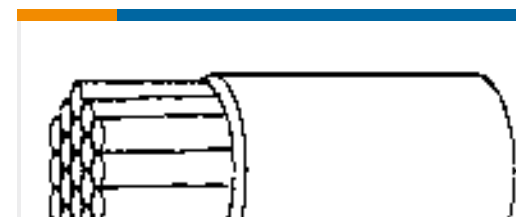
TE Teilenummer 3903893001 55M0414-28-8