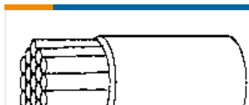
TE Teilenummer 8511673001 55M0414-30-9