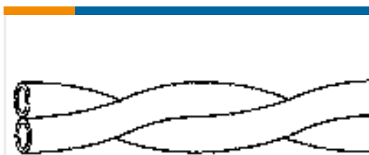
TE Teilenummer 5285793002 55M0424-26-2/6