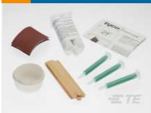
TE Teilenummer 657863-000 S1125-KIT-8