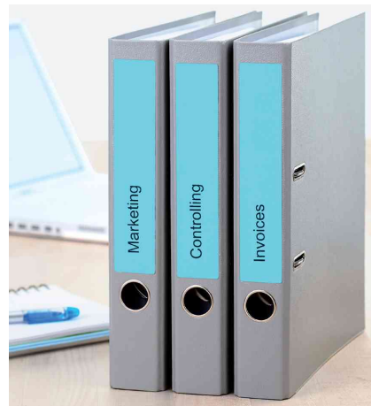
Orderrücken-Etiketten SPECIAL, Anwendung