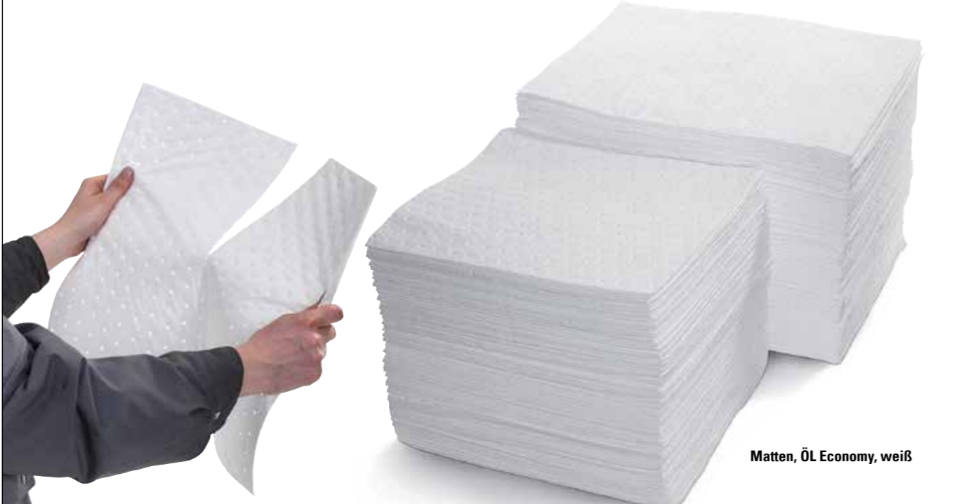
Matten, Öl Economy, weiß