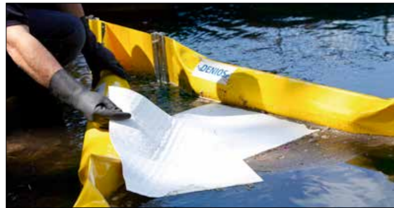
Extrem saugstarke Öl-Bindevliesmatten nehmen auslaufende Flüssigkeiten besonders schnell und sicher auf, auch für den Einsatz auf Wasser, in verschiedenen Größen

Praktisch bis ins Detail: Matten (500 x 400 mm) sind mittig perforiert. Sie können leicht die benötigte Menge abreißen und verbrauchen nur soviel Material, wie zwingend nötig.