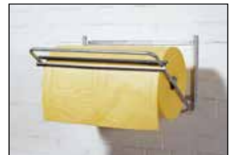
Abrollgeräte für Rollenware 476