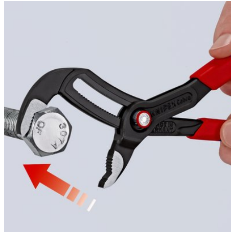
Colocar las mordazas de agarre – cerrar simplemente las tenazas