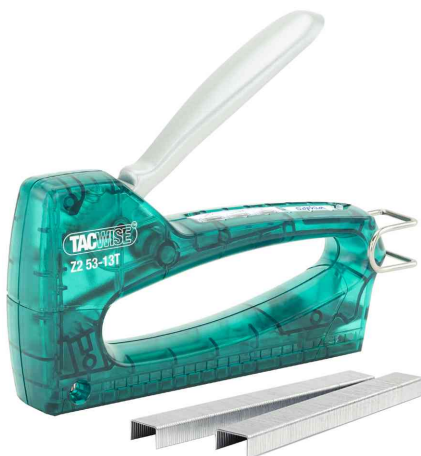
Agrafeuse manuelle Z2 53-13T comprenant 300 agrafes de 53/6 mm