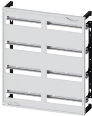
ALPHA 400/630/1250 DIN Einbausatz Installationseinbaugeräte Reihenabstand 150mm H=600mm, B=500mm