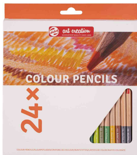
Crayons de couleur Art Creation, étui de 24