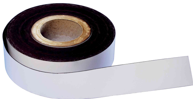
Magnetband, aus PVC

- zur Beschriftung von Planungstafeln, Warenhaus- und Lagerregalen