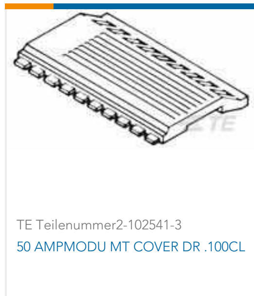
TE Teilenummer2-102541-3 50 AMPMODU MT COVER DR .100CL