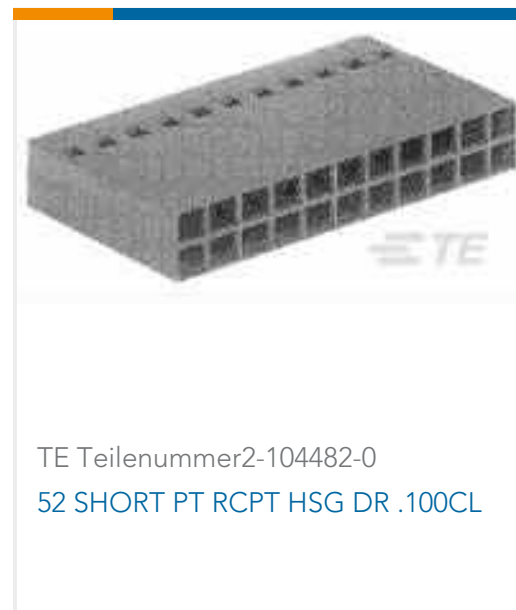
TE Teilenummer2-104482-0 52 SHORT PT RCPT HSG DR .100CL