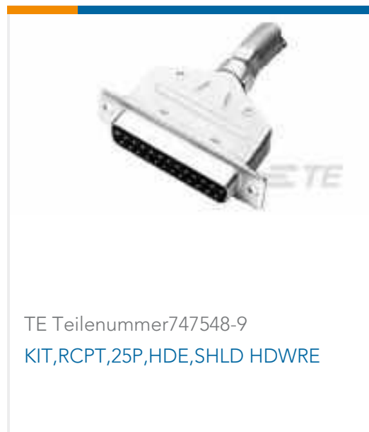
TE Teilenummer747548-9 KIT,RCPT,25P,HDE,SHLD HDWRE