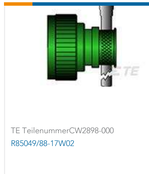
TE TeilenummerCW2898-000 R85049/88-17W02