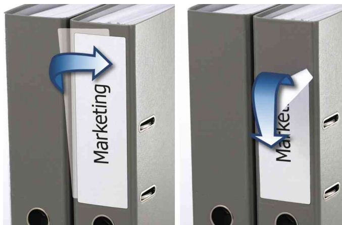
Orderrücken-Etiketten SPECIAL, Anwendung