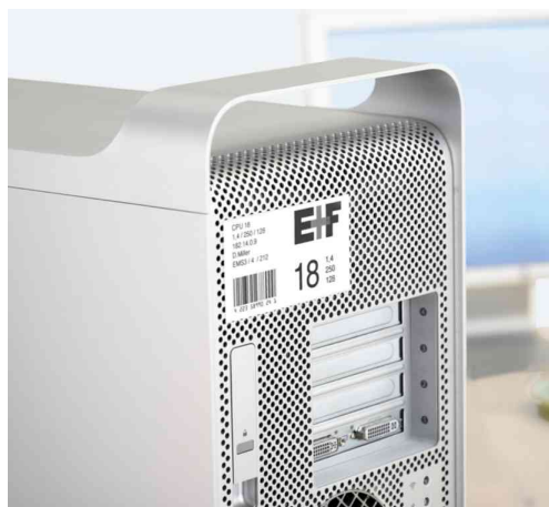
Typenschild-Etiketten SPECIAL, Anwendung