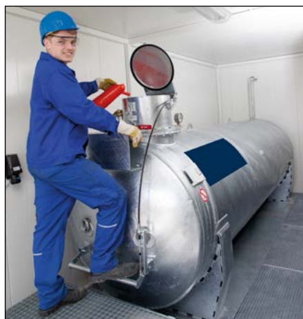
Das Bedienpodest mit Trittpläche und der große Einfülltrichter ermöglichen ein komfortables Befüllen des Behälters.