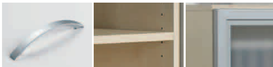
Poignées metall. esthétiques