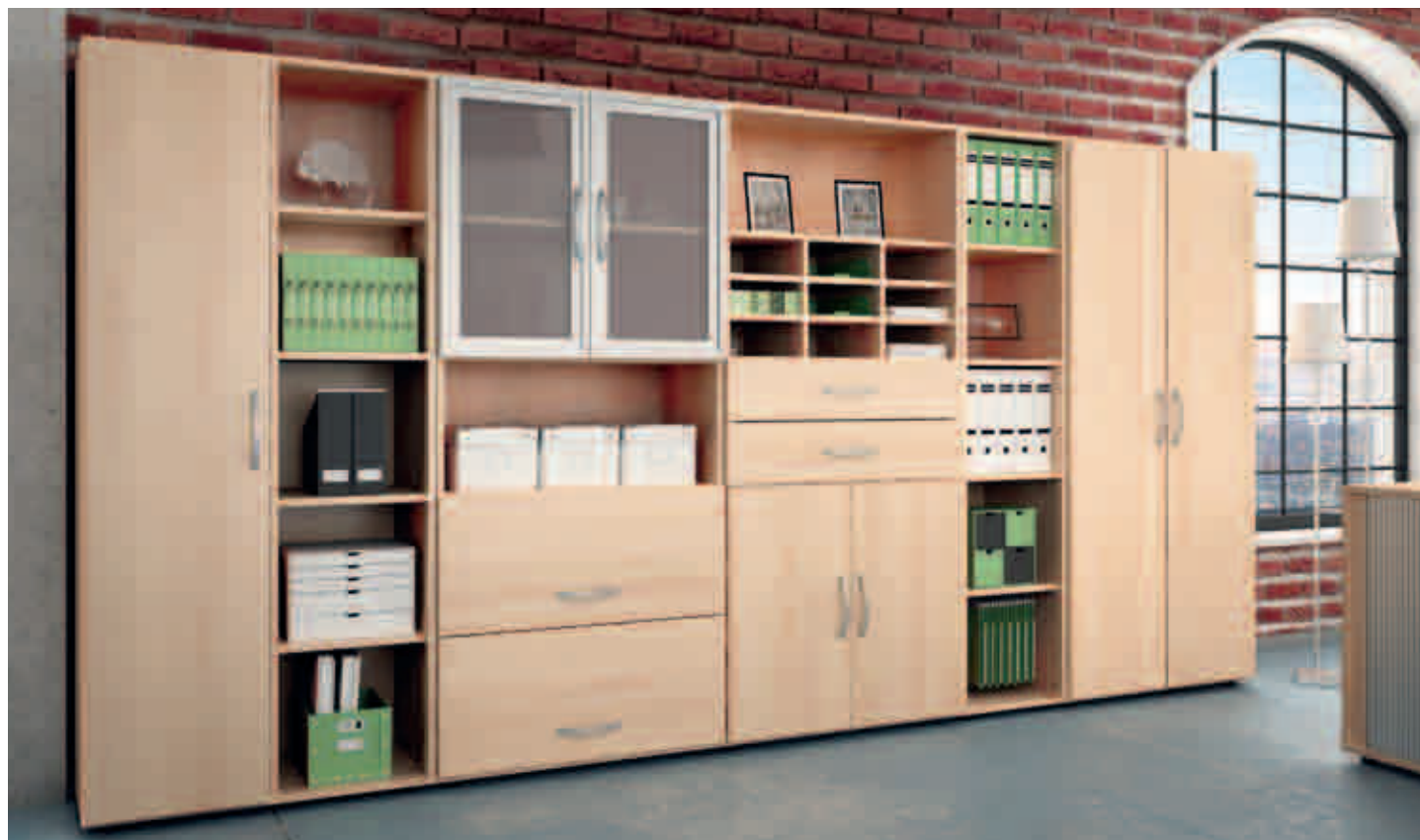
L'illustration montre une finition érable