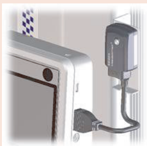
02AZE990 U-WAVE-T rögzítő készlet QM-Height-hoz