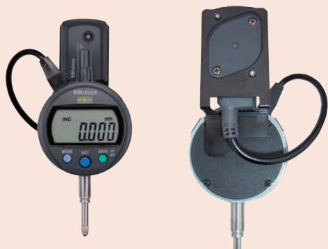
02AZE200 U-WAVE-T rögzítő készlet kijelzőhöz, szénzás tolómérőhöz.