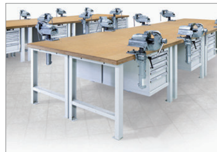
Jederzeit erweiterbar durch 10 Jahre Nachliefergarantie.