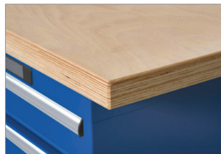
Große Auswahl an verschiedenen Materialien und Oberflächen.