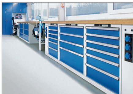
Modulares System mit zahlreichen Konfigurationsmöglichkeiten und hoher Flexibilität.