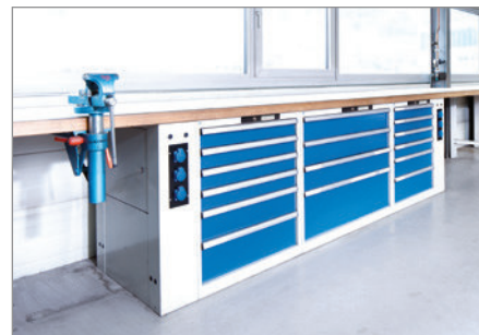
Einfache und schnelle Installation dank Vormontage.