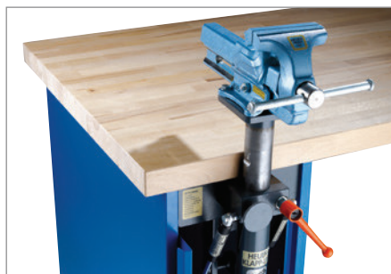
Massive Bauweise für hohe Belastungen bis 3 t.