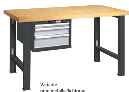
Variante grau metallic/lichtgrau