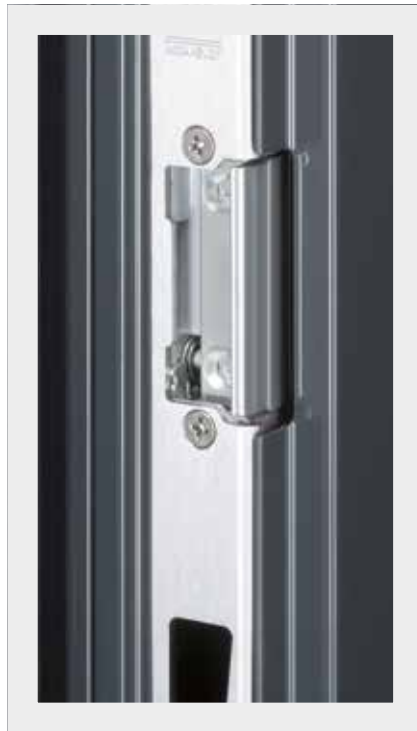
Metall – Einbausituation ALT: