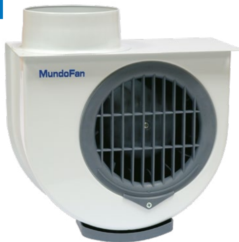
MU CO 300 M