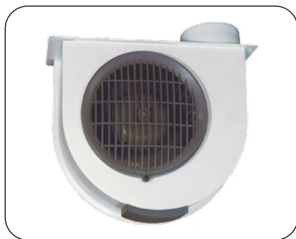
MU CO 500 M