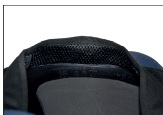
Schweißband aus Funktionsgewebe