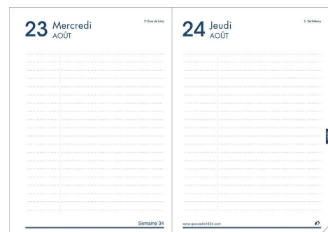
Textagenda - grille 1C