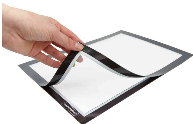
Vue détaillée : fermeture magnétique rabattable