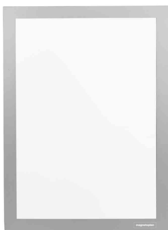
Cadre d'affichage magnetofix, autoadhésif, argent