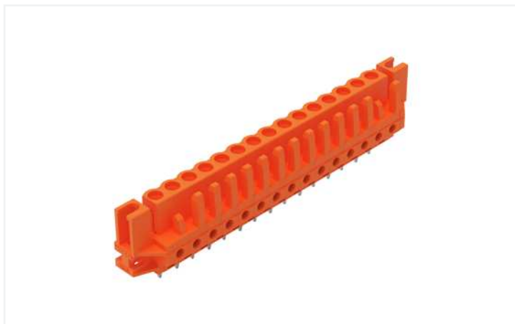
Farbe: ■ orange