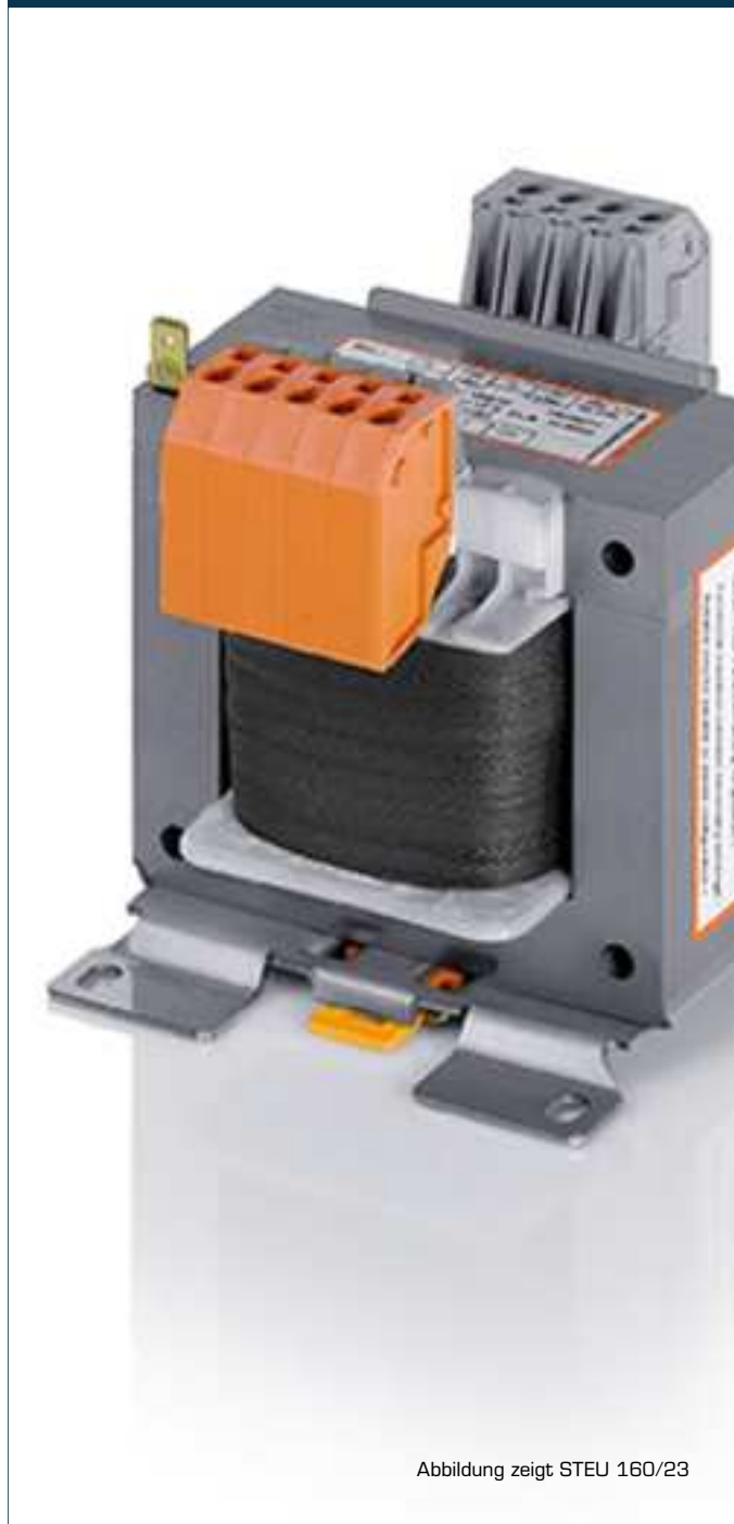
Abbildung zeigt STEU 160/23