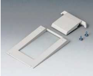
A9250907 Aufstellbügel ABS (UL 94 HB) grauweiß RAL 9002

Technische Änderungen vorbehalten. © OKW Gehäusesysteme, Buchen/Deutschland.