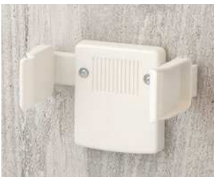
A9226127 Wandhalter-Set ABS (UL 94 HB) grauweiß RAL 9002