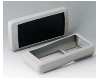
A9175108 Protector L SBS (TPE) vulkan