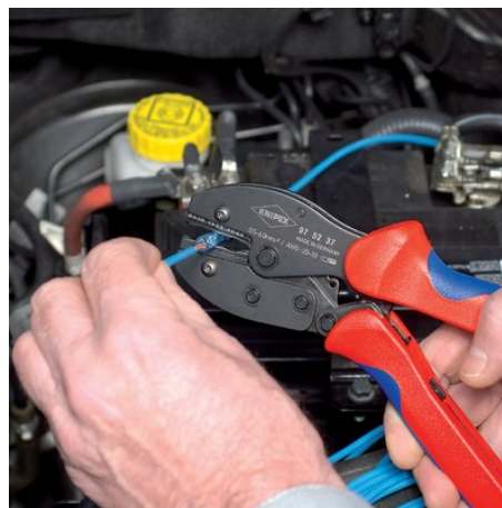
97 52 37