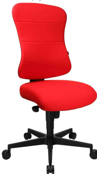
Fauteuil de bureau "Art Comfort", rouge