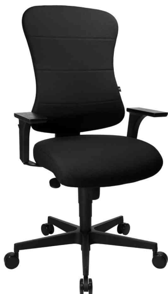
Fauteuil de bureau "Art Comfort", noir avec accoudoir type S2(OPA) en option