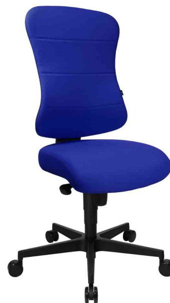
Fauteuil de bureau "Art Comfort", bleu