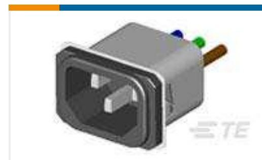
TE Teilnr.:5-1609987-6 15SRBX8=F8287