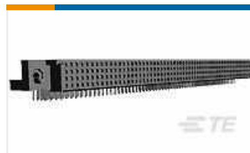
TE Teilnr.:532903-3 HDI RECP ASSY 4 ROW 128 POS