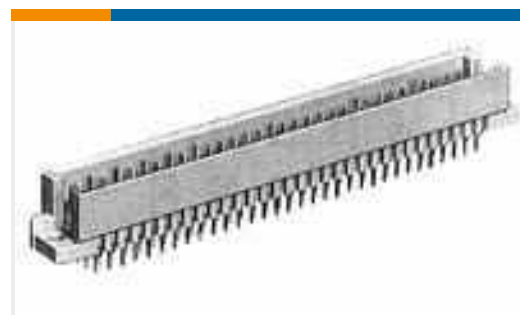
TE Teilnr.:536019-5 096 EURO TYP R PIN AP MFBL ASY