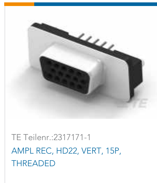
TE Teilnr.:2317171-1 AMPL REC, HD22, VERT, 15P, THREADED