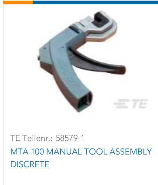
TE Teilnr.: 58579-1 MTA 100 MANUAL TOOL ASSEMBLY DISCRETE