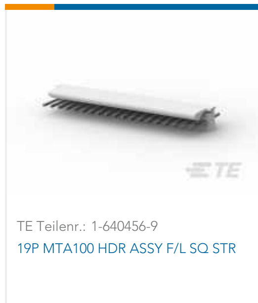
TE Teilnr.: 1-640456-9 19P MTA100 HDR ASSY F/L SQ STR