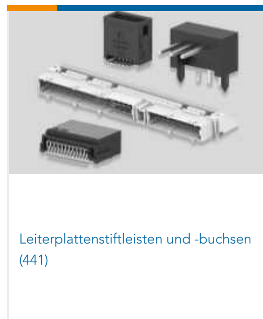
Leiterplattenstiftleisten und -buchsen (441)