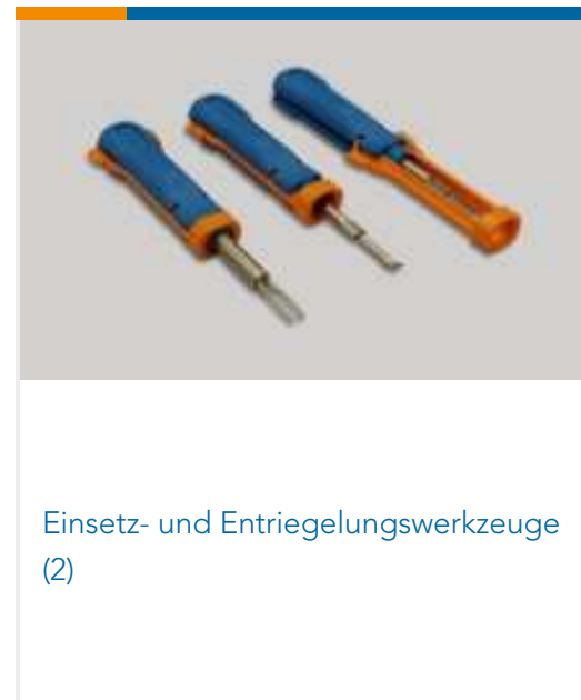
Einsetz- und Entriegelungswerkzeuge (2)