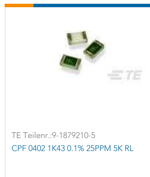
TE Teilnr.:9-1879210-5 CPF 0402 1K43 0.1% 25PPM 5K RL