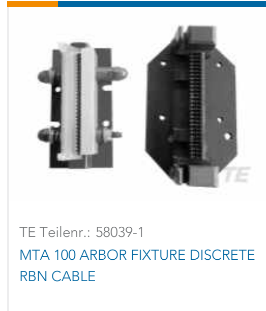
TE Teilnr.: 58039-1 MTA 100 ARBOR FIXTURE DISCRETE RBN CABLE