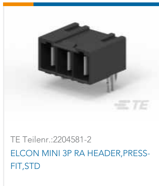
TE Teilnr.:2204581-2 ELCON MINI 3P RA HEADER,PRESS-FIT,STD