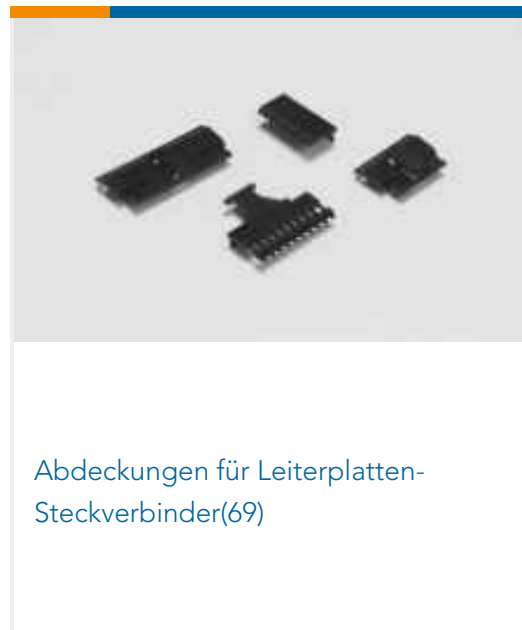
Abdeckungen für Leiterplatten-Steckverbinder(69)