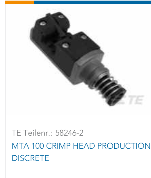
TE Teilnr.: 58246-2 MTA 100 CRIMP HEAD PRODUCTION DISCRETE