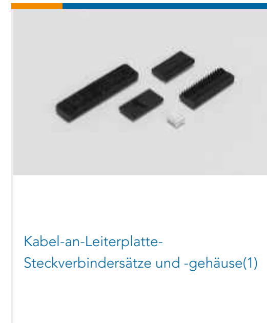
Kabel-an-Leiterplatte-Steckverbindersätze und -gehäuse(1)