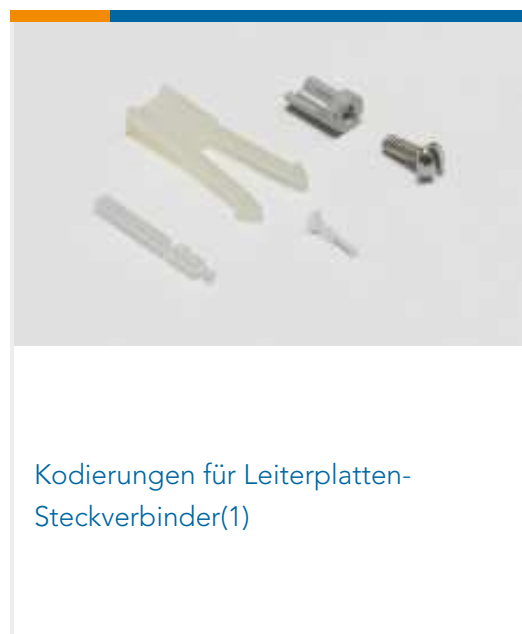
Kodierungen für Leiterplatten-Steckverbinder(1)