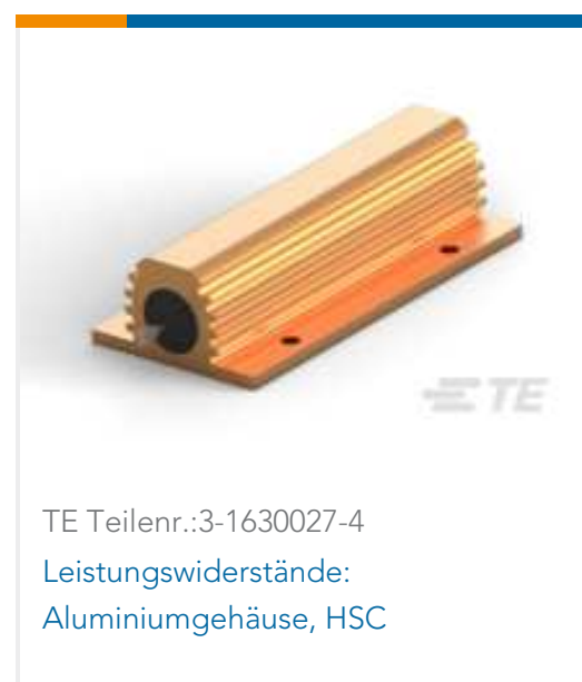
TE Teilnr.:3-1630027-4 Leistungswiderstände: Aluminiumgehäuse, HSC