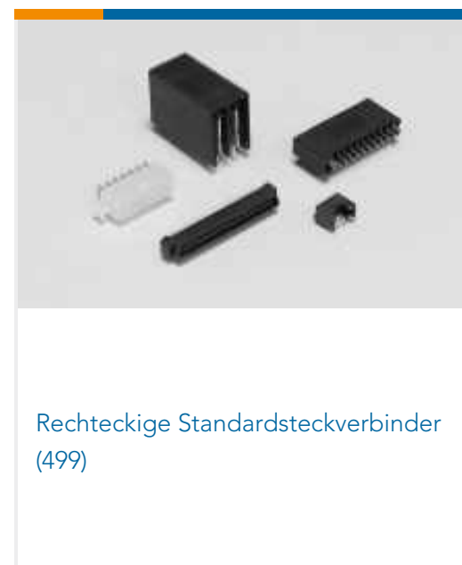
Rechteckige Standardsteckverbinder (499)