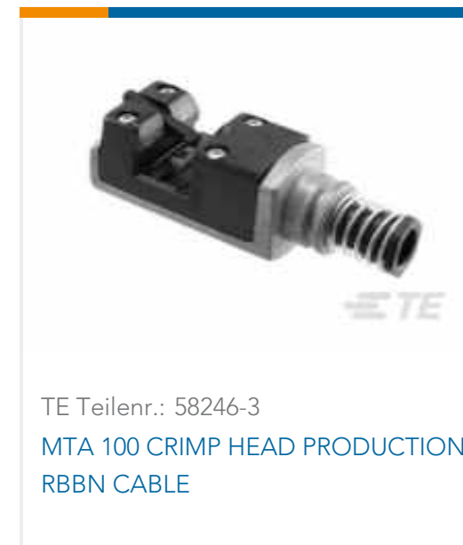
TE Teilnr.: 58246-3 MTA 100 CRIMP HEAD PRODUCTION RBBN CABLE