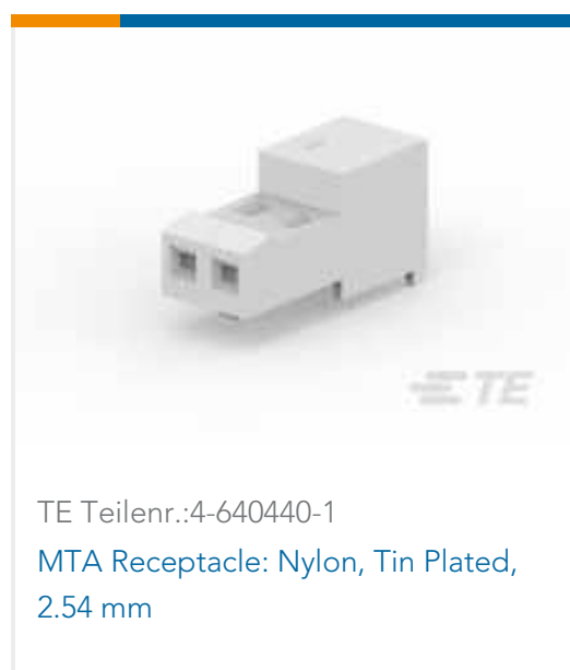
TE Teilnr.:4-640440-1 MTA Receptacle: Nylon, Tin Plated, 2.54 mm