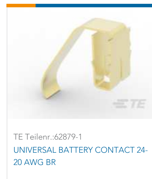
TE Teilnr.:62879-1 UNIVERSAL BATTERY CONTACT 24-20 AWG BR