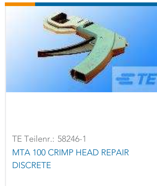
TE Teilnr.: 58246-1 MTA 100 CRIMP HEAD REPAIR DISCRETE