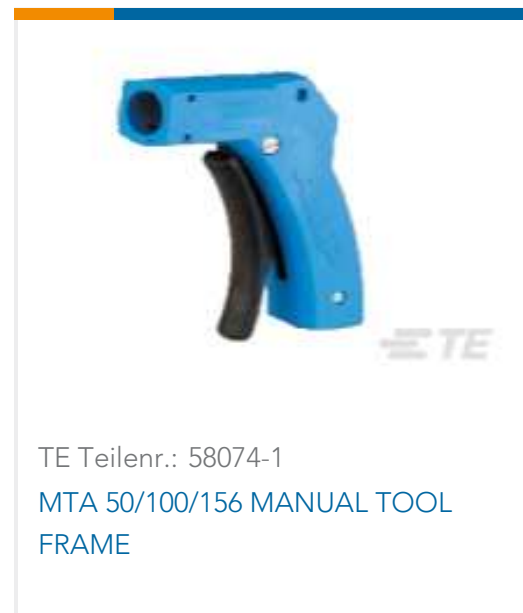
TE Teilnr.: 58074-1 MTA 50/100/156 MANUAL TOOL FRAME