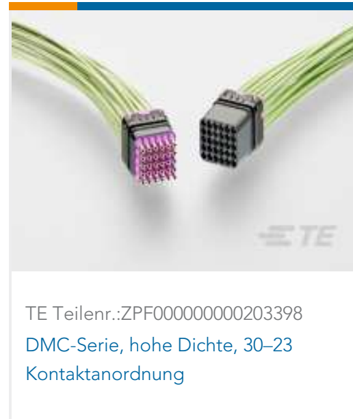
TE Teilnr.:ZPF000000000203398 DMC-Serie, hohe Dichte, 30-23 Kontaktnanordnung