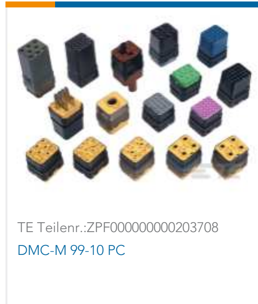
TE Teilnr.:ZPF000000000203708 DMC-M 99-10 PC