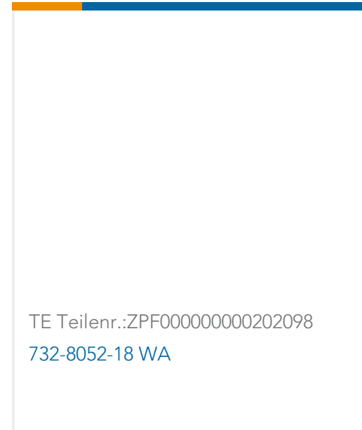
TE Teilnr.:ZPF000000000202098 732-8052-18 WA