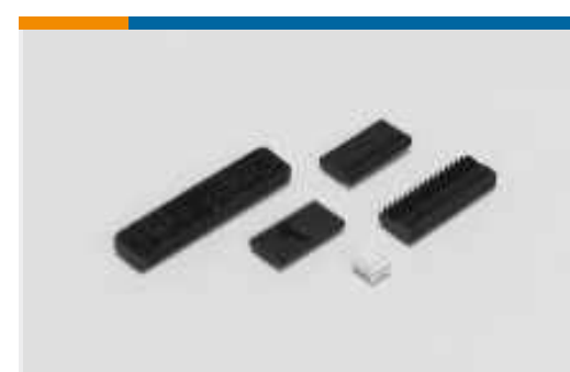
Kabel-an-Leiterplatte-Steckverbindersätze und -gehäuse(3)