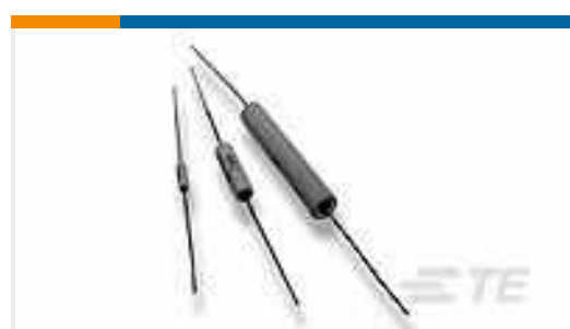
TE Teilenummer1879099-3 HJ65 4M0 0.1% 50PPM