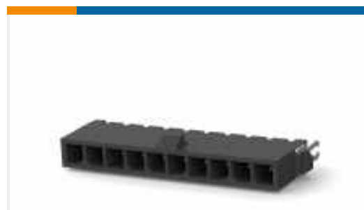
TE Teilenummer1-2029037-0 MICRO MNL HDR ASY SR AU LF SPC