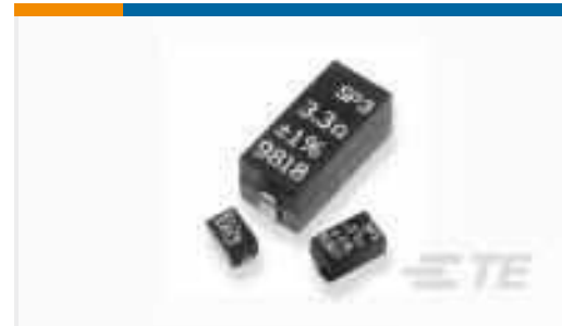
TE Teilenummer1-1624320-1 SP3 2R0 1% LOOSE