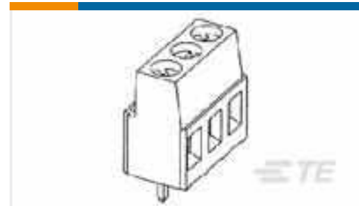
TE Teilenummer796683-5 TERMI-BLOK PCB MOUNT 90 5P.