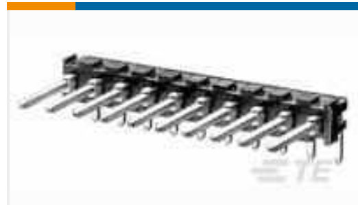
TE Teilenummer827795-7 7P MOD2 STIFT LEI