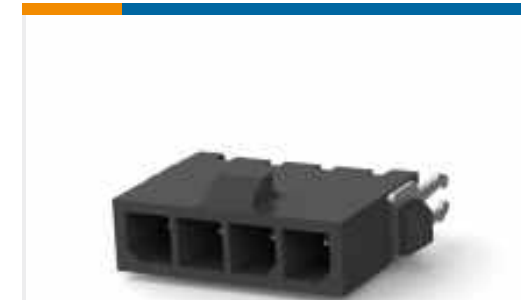
TE Teilenummer2029037-4 MICRO MNL HDR ASY SR AU LF SPC