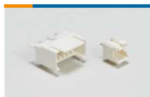
Draht-an-Leiterplatte-Steckkontakte und -sockel(75)