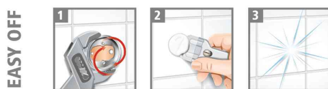
Etapas de la fixation