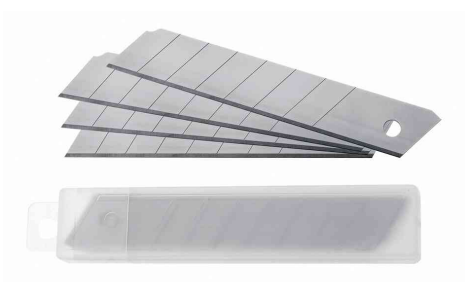
Ersatzklingen für Cutter E-84003, E-84004, E-84005, E-84006, E-84025, E-84028