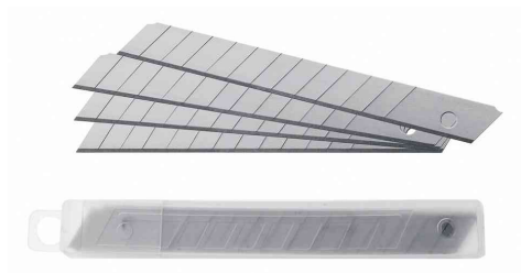
Ersatzklingen für Cutter E-84000, E-84001, E-84002, E-84021, E-84024, E-84027

Bestell-Nr. 62350068: für Cutter E-18692 (Crossfire), Professional E-84009, E-84019, E-84022, E-84023, E-84026, Universal-Messer E-84029