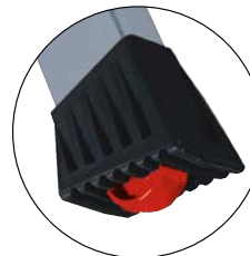
Roll / Stop-Automatik